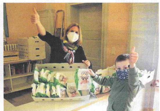
Die Stauffenbergsschule bedankt sich