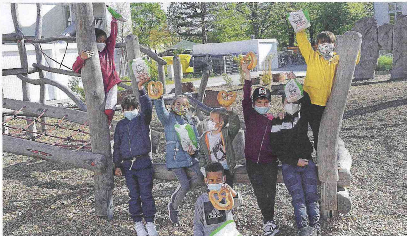
Die Kinder der Albert-Schweitzer-Schule freuten sich über die Sommertagsbrezeln